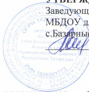
График рабочего времени сотрудников на 2020г МБДОУ детский сад «Берёзка» с.Базарные Матаки АМР РТ